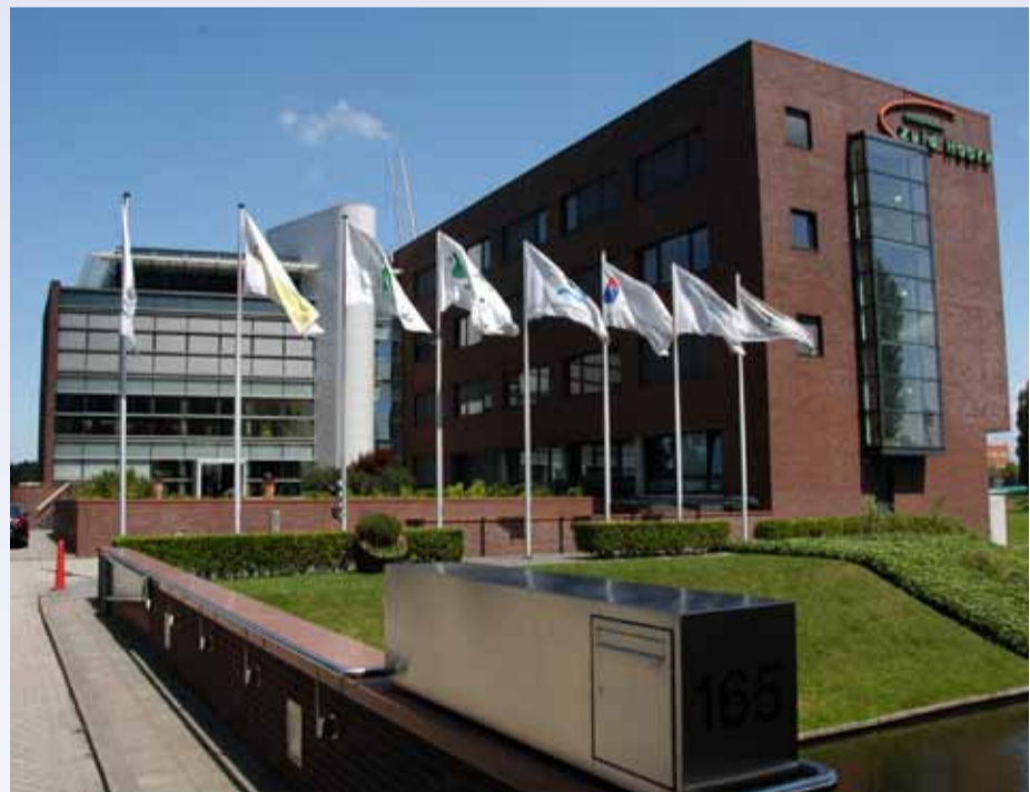
Pensioenfonds TNO te Rijswijk

Wij kunnen, indien u dat wenst, online de pensioensituatie inzien via onze Pensioenplanner of de landelijke website mijnpensioenoverzicht.nl . Handig is het om in dat geval uw gebruikersnaam en wachtwoord bij de hand te hebben. Bent u deelnemer dan kunt u natuurlijk ook voor nadere uitleg het Uniform Pensioenoverzicht (UPO) meenemen dat dit jaar door ons is toegezonden.